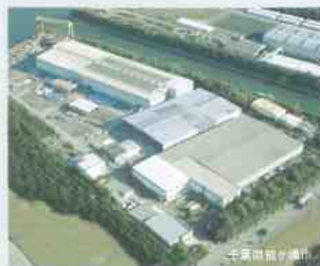
年間600棟を超える生産実績を誇る千葉工場

yess建築 (Yokogawa Engineered Structure System) は、(株)横河システム建築が倉庫・工場をはじめとする低層建築(平屋及び2階建)を対象に[経済性・耐久性・意匠性]を重視して開発された安心と信頼のシステム建築技術です。